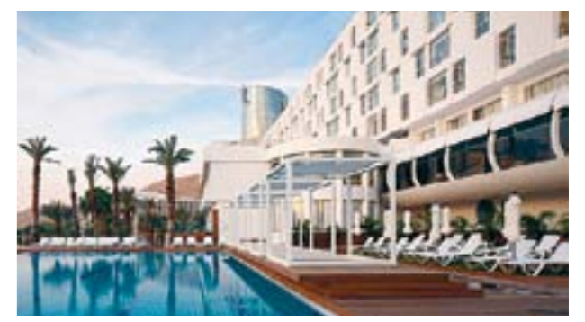
ישרוטל גנים. מגרסה למלון מיוחד ומושקע

פעם בשנה הופך ים המלח לרלבנטי, שלא לומר לאטרקטיבי במיוחד, עבור הנופשים הישראליים. זה כמובן קורה במקביל לאירועי האופרה במצדה שמתקיימים למשך כשבוע ימים. בשאר 51 השבועות, על פי רוב, הבחירות הטבעיות הן חופשה באילת או בצפון, וים המלח לא נמצא גבוה ברשימת ה"חיוג המהיר" שלי. אולי בגלל חזיונה של המקום עם מחלות עור, אולי בגלל העובדה שהא הולך ומתייבש, ואולי כי מתחתם